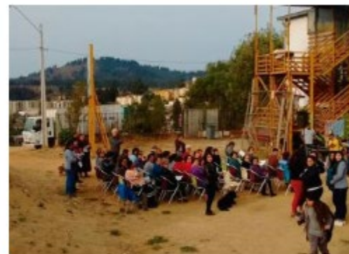
Regeneración de condominio Chile