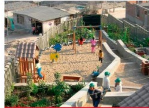
Mejorar las condiciones de vi... Perú