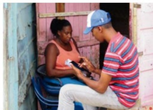
Tecnoecópolis: Ecobarrio 3.0 República Dominicana