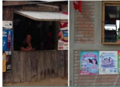
Mejoramiento Integral del H... Nicaragua