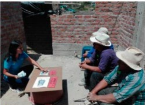
Construyendo Confianza par... Perú