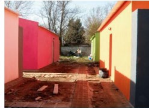
Circuito productivo local de c... Argentina