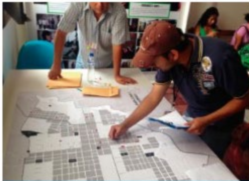
Programa de Vivienda por C... Guatemala