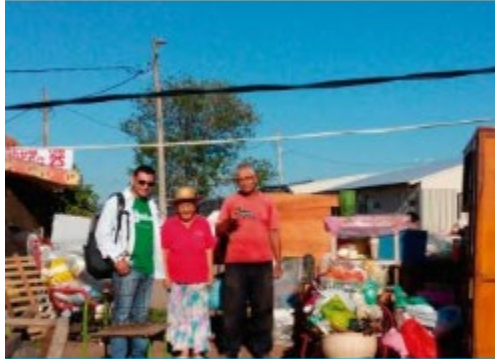
Modelo de acompañamiento ... Paraguay