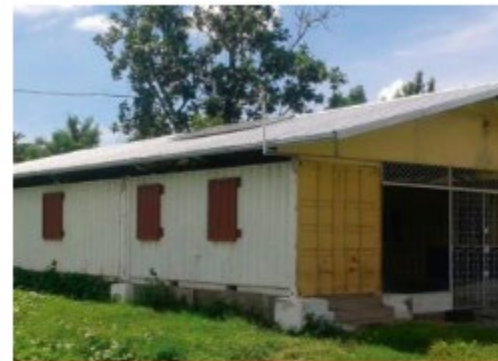
Building Resilience and Capa... Jamaica