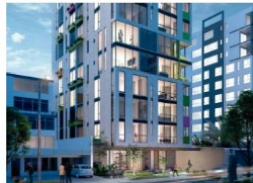
Herramienta de Eco-Eficiencia Ecuador