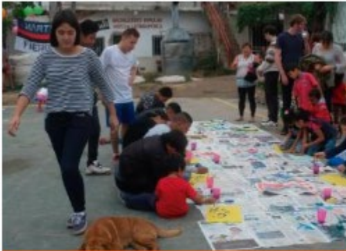
Caminos de la Villa Argentina