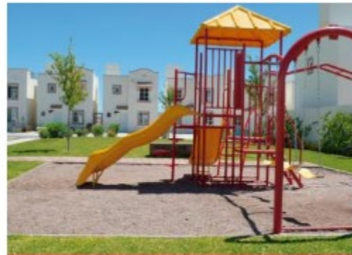
Programa EcoCasa México