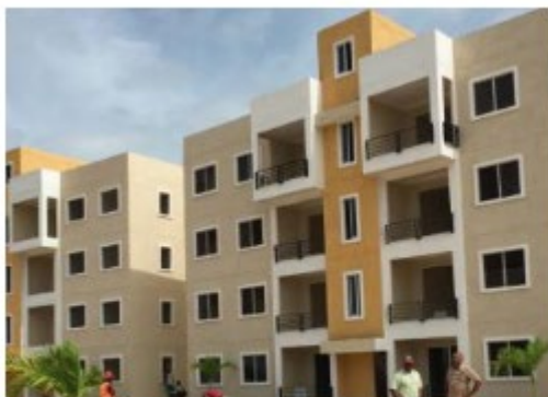
Proyecto Ciudad Juan Bosch República Dominicana