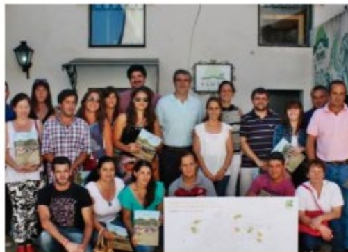
Agencia Municipal de Hábitat Argentina