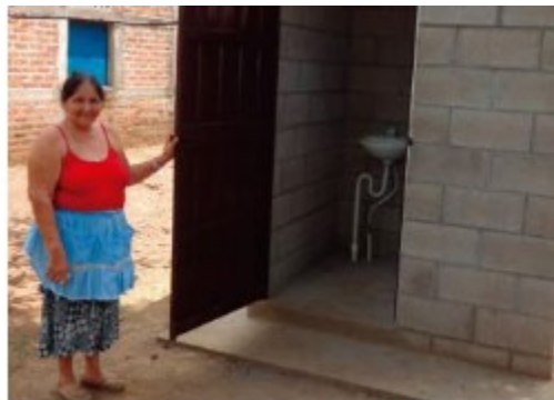
Programa de Mejoramiento I... El Salvador