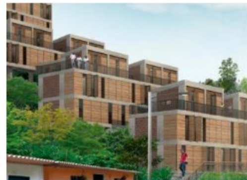
Barrios Sostenibles: Mejora... Colombia