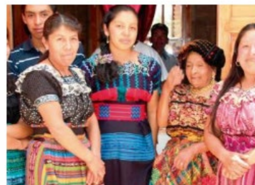
Vivienda social sostenible Guatemala