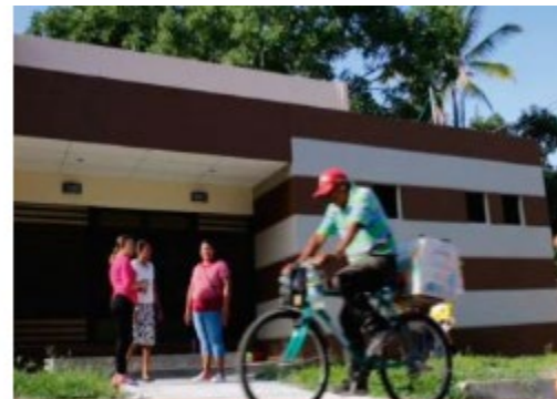
Programa de Reducción de V... El Salvador