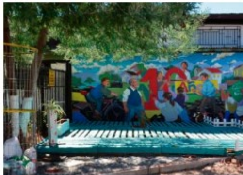
Brilla El Sol, protagonismo c... Chile