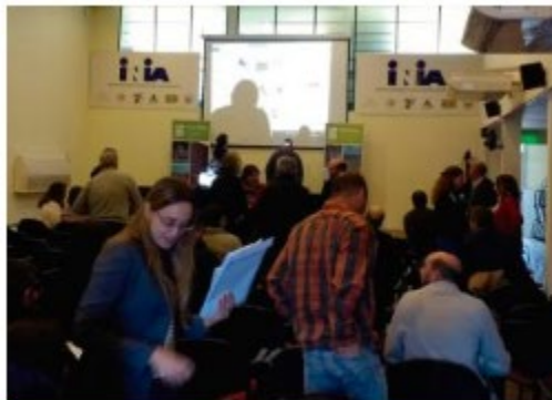
Estrategia Nacional de Acces... Uruguay