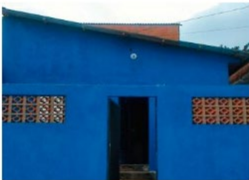
Bono de impacto para mejor... Brasil