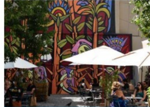
Plazas Públicas de Bolsillo Chile