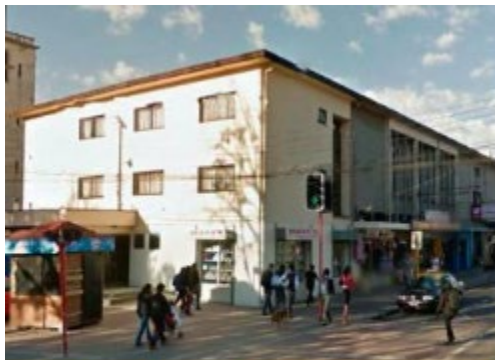
Política de Arriendo: Promoc... Chile