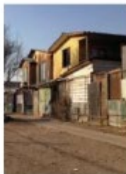
Proyecto Piloto para la Regeneración Chile