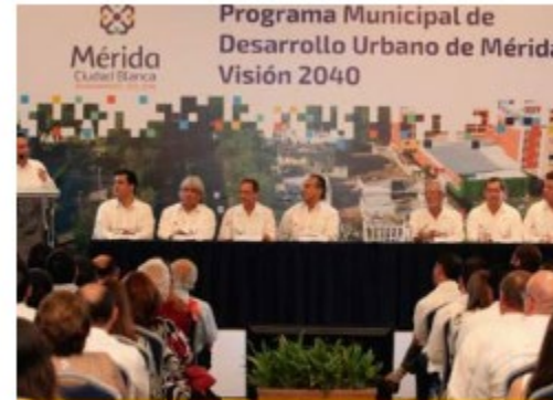
Programa Municipal de Desa... México