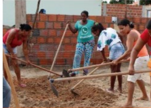
Moradia Urbana com Tecnol... Brasil