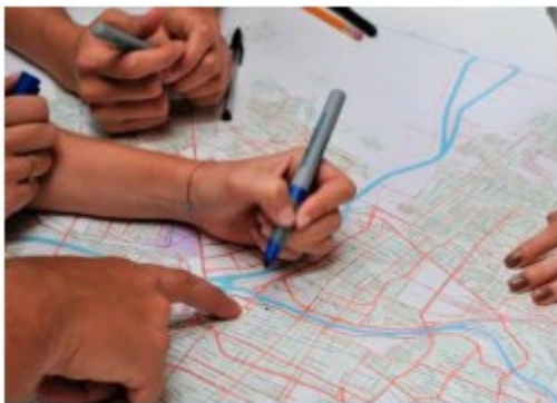
Actualización del Sistema M... México