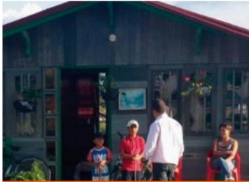
Llena una botella de amor Colombia